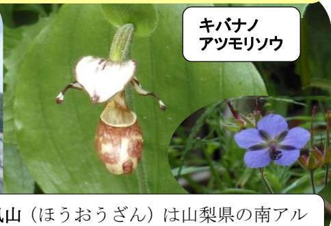
キバナノアツモリソウ