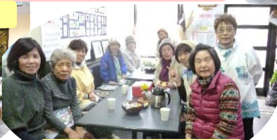
まるごと館納め・お茶の時間です