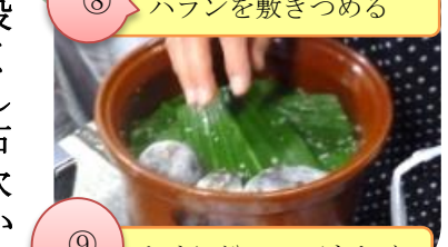
ハランを敷き詰める