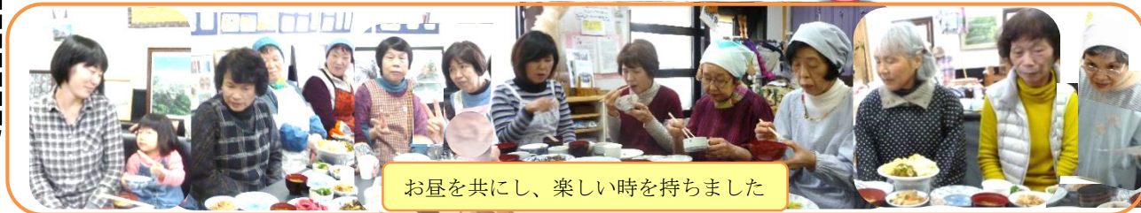
お昼を共にし、楽しい時を持ちました

八幡まるごと館は街行く人のだれもが自由に立ち寄れる“地域サロン”です。休館日は毎週火曜日全日と土・日午後です。