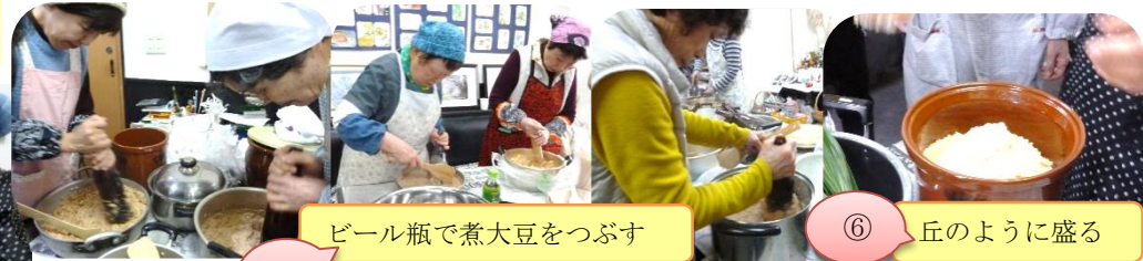
ビール瓶で煮大豆をつぶす