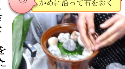
かめに沿って石をおく