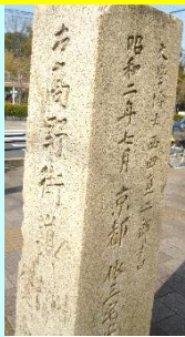
月夜田交差点右 高野街道の道標