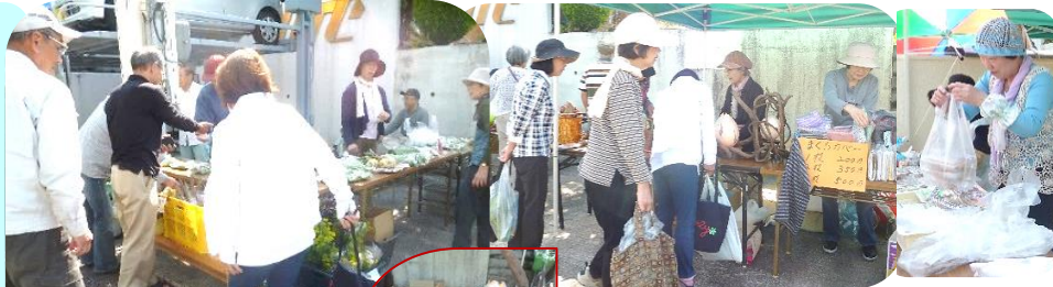
5月17日春のまるごと市