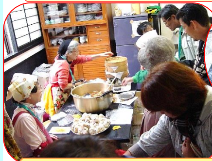
第1回 2009 年秋のまるごと市