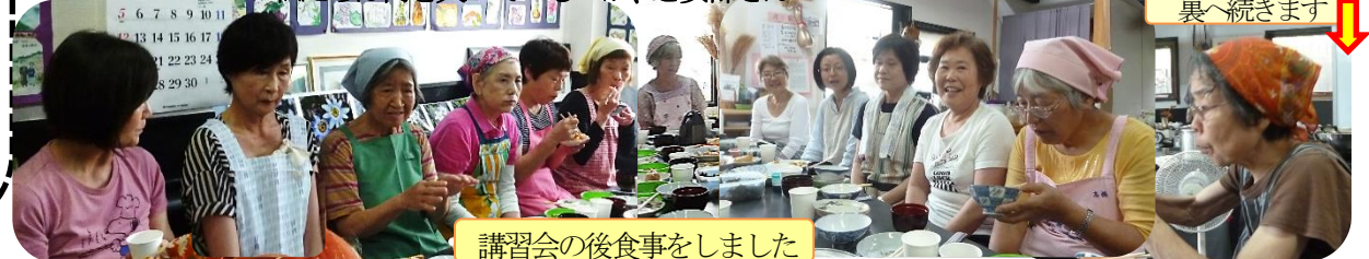
講習会の後食事をしました

八幡まるごと館は街行く人のだれもが自由に立ち寄れる“地域サロン”です。休館日は毎週火曜日全日と土・日午後です。