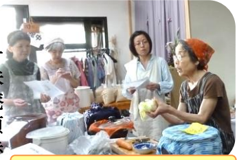
野菜の漬け方のお話

働いていて忙しい時には出来なかった、自分で暮らしを作るということ。ほんの一部ですが、味噌・漬物・沢庵など教えて頂き、少しずつ歩き出しているところでしょうか。手間ひまかけることの意味は「食を自分の手に取り戻すこと」になるのではないかと、思うのですが、今は梅干しに挑戦。おふたりから多くのことを学んでい