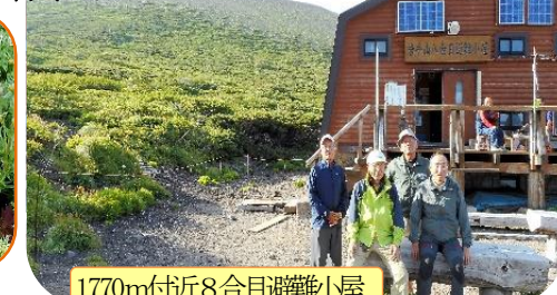
1770m付近8合目避難小屋