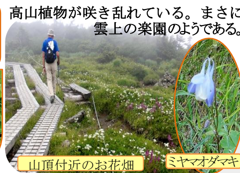
山頂付近のお花畑