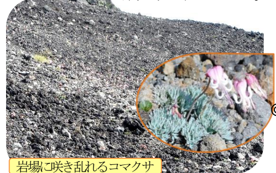
岩場に咲き乱れるコマクサ

6時30分山頂(2026m)到着。快晴、360度のパノラマ。火口の縁を巡って、東側から山頂方向を見ると、火口の山があるものに似ている。誰かが「おっばい山を背に写真を撮ろう」と口にした。