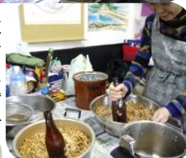
塩糶を混ぜて待つ

重石としての小石の意味は何でしょうか。たまりが上がり、表面を覆うため味噌生地が空気に触れなくなり、生地をカビから守ることが出来る。また、たまりは発酵が進んでいる証拠でもあります。取って料理にも使えます。とても美味しいです。 酒粕をしく 今回重石のかわりに酒粕