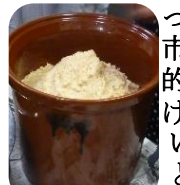
味噌生地をカメに