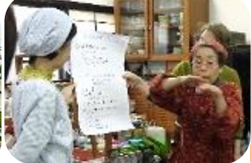
バランの出の小石を

まるごと館オープンから毎年欠かさずに行なってきた味噌作り。今回は12人の方が煮大豆を鍋ごと持って来られました。今まで8回実施の中で最も多い人数です。講師として使