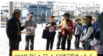
2017年4月4日街道をゆく

私は元の八幡地域の東高野街道筋で「まちかど博物館・城ノ内」を立ち上げました(その後近隣の6館と協議会を設立)。今も門前町付近にあって大切な地域の歴史・文化を発信し、まちの良さをもっと知ってもらふこと、そして誇りを持って楽しく暮らそうと活動をしています。