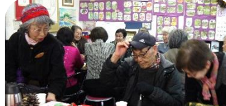
2016年12月11日クリスマスコンサート