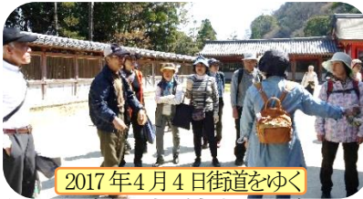
2017年4月4日街道をゆく

また、この間まるごと館の「シリーズ・まちを行く」に、微力ですがご一緒させてもらい多くの方々と交流が叶い、共に学び活動できたことを嬉しく思っています。