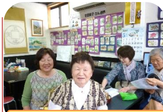
2016年5月29日アイウコンサートの様子