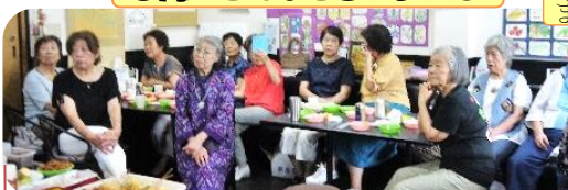
まるごと館納涼会