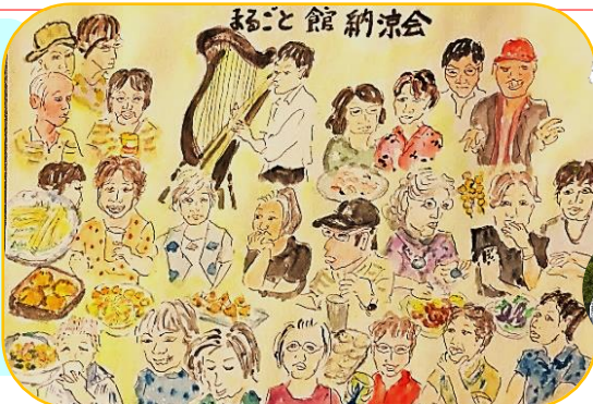
まるごと館納涼会