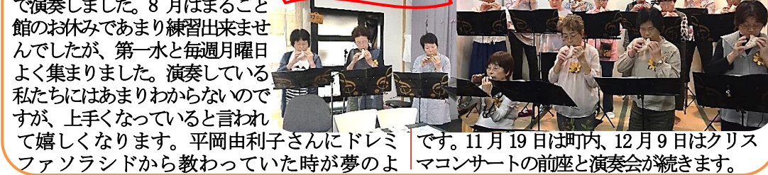
オカリナひまわり