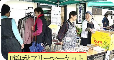
昨年秋フリーマーケット

10月21日(日)に、1年に春秋と2回ずつ実施してきて、今回で19回目となります。この季節、秋の一番いい時、各地で多様な催しが行われます。今年は猛暑、水害、地震、台風等の異常気象に振り回されて、未だにその余波の中で暮らしています。21日半日ですが、どうぞまるごと館にお越し頂き、のんびりと過ごされませんか。お友だちとどうぞ。館内ではコーヒー、お茶を飲みます。他に絵手紙等の展示やさをり織体験を行なっています。コースターを織っていただきます。ご自由どうぞ。