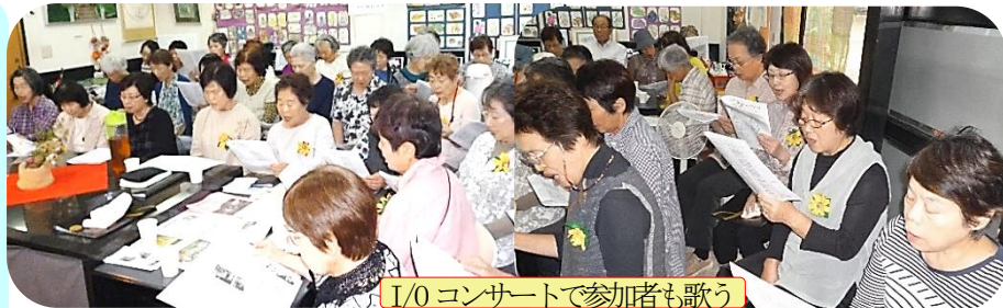
I/O コンサートで参加者も歌う

●10月21日9時〜12時30分 ●新米野菜手作り品・炊込み等 ●フリーマーケットあと数店募集中!!