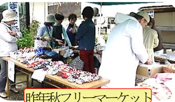
昨年秋フリーマーケット