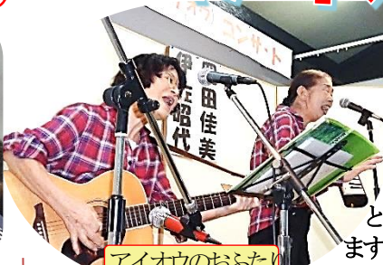
アイオウのおふたり