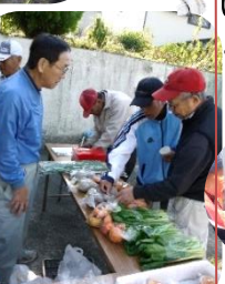
パッチワーク干し柿