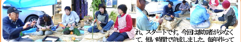
れ、スタートです。今回は参加者が少なく、短い時間で完成しました。毎年作っていても、中々すぐには作れませんね。1年に1回のことですから、もう次の予約があります。