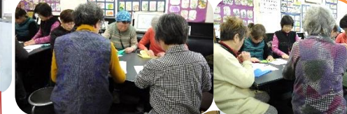
います。次は吊るし雛、楽しみに待っています。