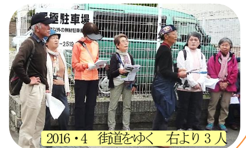
2016・4 街道をゆく 右より3人