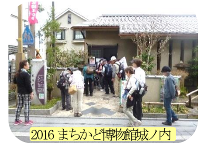
2016 まちかど博物館館内ノ内

私たちの活動は、彼の思いにはまだまだ十分とは言えませんが、これからも彼の構想実現のために「まるごと館」と連携させてもらいたいと私は考えています。