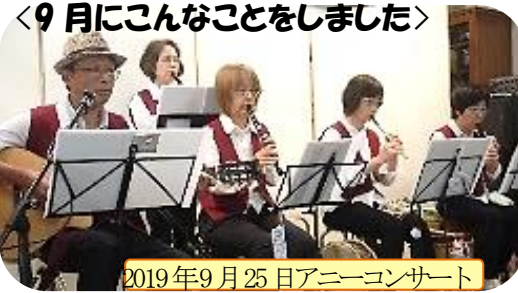
2019年9月25日アニーコンサート 島の子どものための保養キャンプ寄付でき、まるごと市その日を楽しんでいます。

て現在に至っています。当初はまるごと館を知ってもらう、運営費用を集めるが、まるごと市の目的でしたが、ここ数年では変わってきています。日常的な野菜販売で賄えるように、今では収益の一部を福