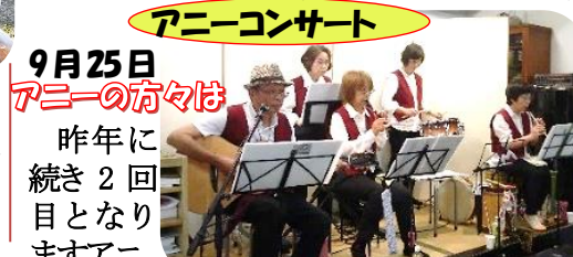
9月25日アニーの夕々ほ 昨年引き続き2回目となりますアニー

例年10月の第3日曜日でしたが、都合がつかなくて予定を変えました。フリーマーケットご希望の方どうぞ出店下さい。あと数店です。秋の半日ですが、どうぞ館内にもお入り下さい。お待ちしております。