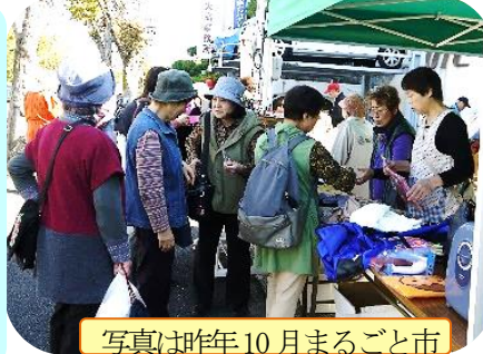
写真:昨年10月まるごと市