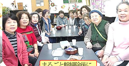
まるごと館掃除後に