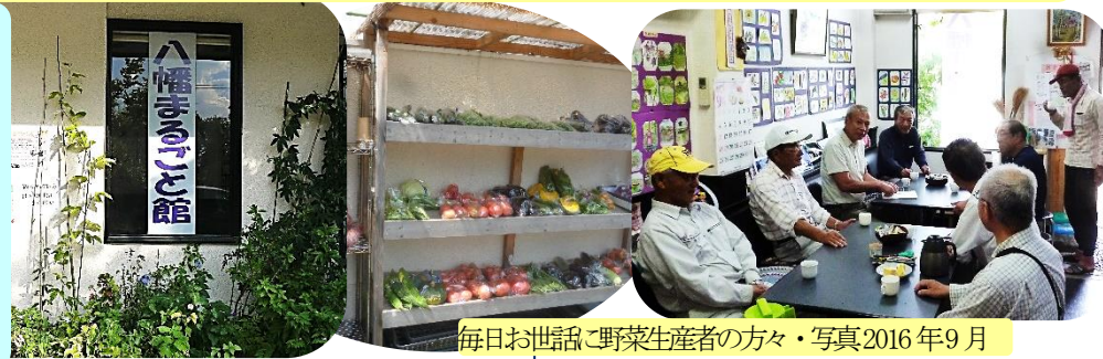
毎日お世話に野菜生産者の方々・写真2016年9月