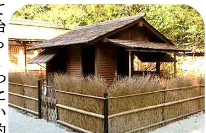
河合神社方丈庵復元より