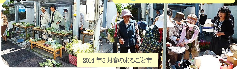
2014年5月春のまるごと市