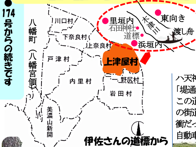
伊佐さんの道標から