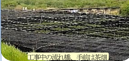
工事中の流れ橋、手前は茶畑

ハ天神森 奈良へ「堤内西ハ楠葉 枚方へ」「堤通北ハよど 八幡へ」と書かれています。この道標からこの地域が木津川の水路と(横の街道の)陸路の接点で東西南北の交通の要衝だったことがわかります。当たり前ですが、自動車はないし、当時は交通で船が大きな位