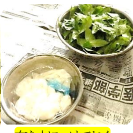
布を液につけておく