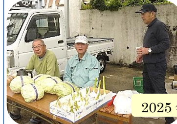
2025年春のまるごと市