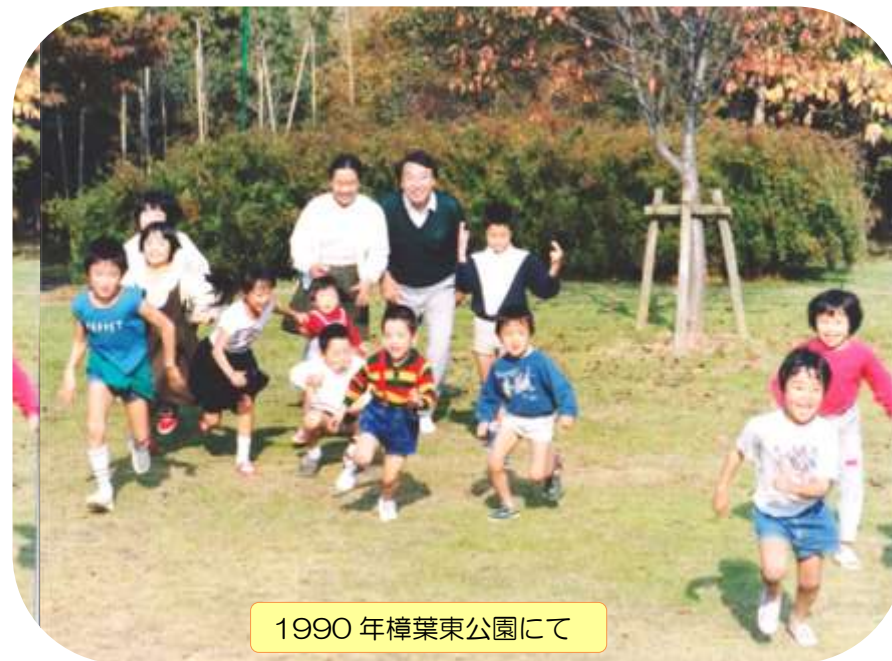
1990年樟葉東公園にて