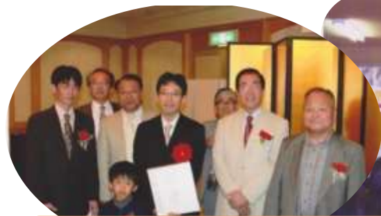
将棋 57 期名人・元四小出身の佐藤康光さん