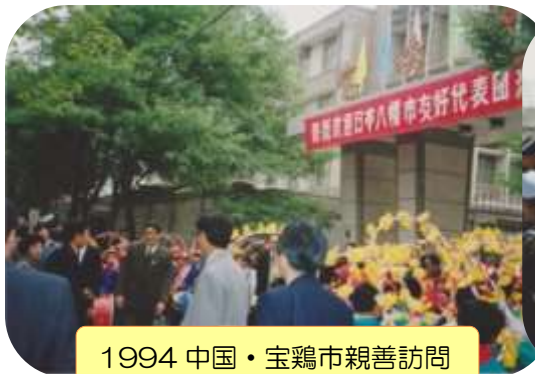
1994 中国・宝鷄市親善訪問