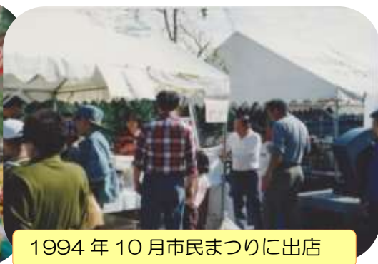
1994 年 10 月市民まつりに出店