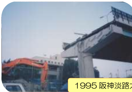
1995 阪神淡路大震災後 1. 26