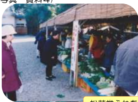
松花堂ふれあい市