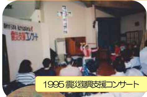
1995 震災復興支援コンサート