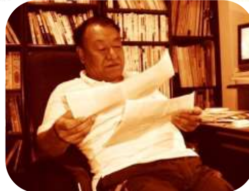
2000年8月16日事務所にて

う、リサイクルを考えよう、在日外国人の指紋押捺を考えようと同世代が集まって住民運動をするうち、そのまま終わらせたくないと思ったのが、市議選出馬に至るきっかけ。九一年初当選。市議会総務委員、市監査委員を務め、「行財政のリストラ」から「男山ふるさと構想提案」まで幅広く発言している。「身の回りから変革し