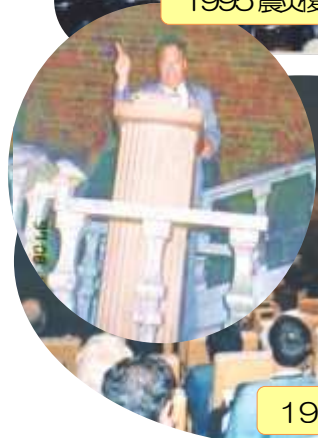
1997. 8 スtockホルム会議参加