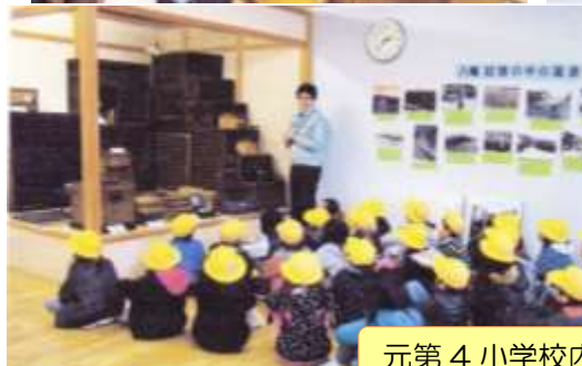
元第 4 小学校内ふるさと学習館