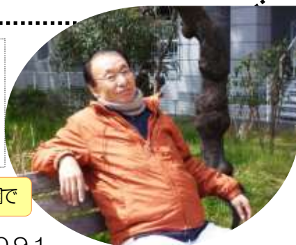
2012年3月病院近くの鞆公園で